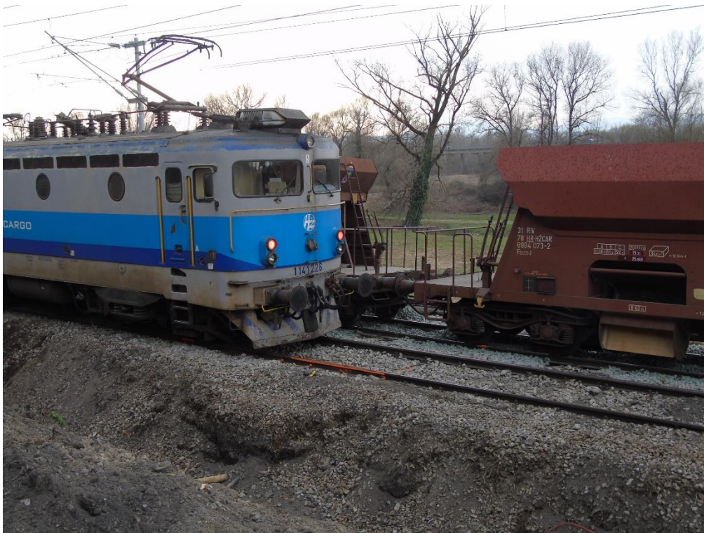
Slika 1. Opći snimak nesreće

U navedenoj nesreći smrtno je stradao pružni radnik koji je obavljao poslove pružnog poslovođe.