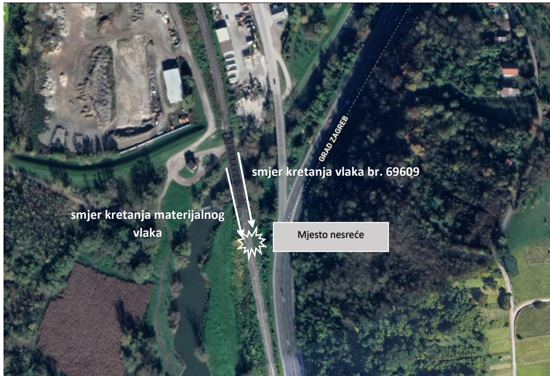
Slika 2. – Lokacija nesreće