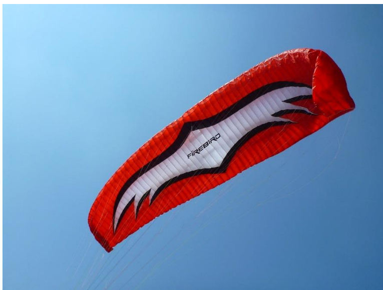
Slika 3. – Parajedrilica Firebird Eagle

Proizvođač: Firebird Tip: Eagle 2-L Serijski broj: Eagle 2-L-2001-10K028 Godina proizvodnje: 2010. Namjena: za slobodno letenje Posada: 1 pilot Putnici: 0 Minimalna poletna težina: 100 kg Maksimalna poletna težina: 125 kg Broj testa: EAPR-GS-7218/09 Kategorija: EN C