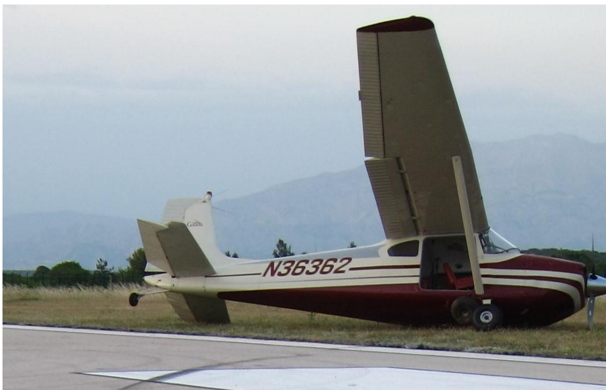
Slika 1. – Zrakoplov N36362 na mjestu nesreće

Zrakoplov je u ovoj nesreći znatno oštećen. Lijevo krilo i lijevi horizontalni stabilizator znatno su oštećeni, a upornica slomljena. Krakovi propelera deformirani su uslijed udara u tlo. Slomljena je lijeva noga stajnog trapa. Vjetrobransko staklo pomaknuto je iz svog ležišta, a desna vrata su odvojena od trupa.