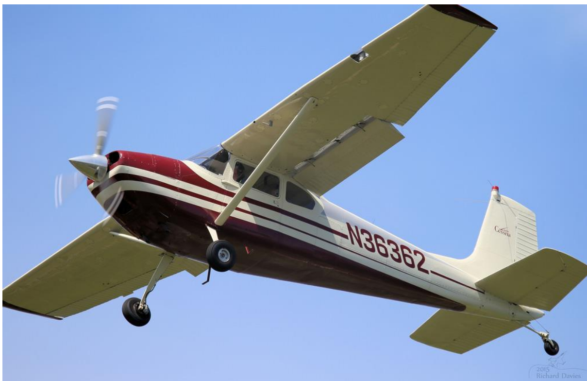
Slika 2. – Zrakoplov Cessna 180, reg. oznake N36362