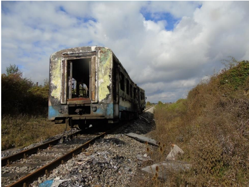
Slika 1. Opožarena dizel motorna garnitura serije 7121 na mjestu zaustavljanja

Dana 16. listopada 2020. godine u 21:10 sati prilikom prometovanja putničkog vlaka broj 6016 po pruzi oznake R202 u KM 072+600 nedaleko kolodvora Našice došlo je do požara na dizel motornoj garnituri serije 7121-101 (Slika 1.). U trenutku nastanka požara u vlaka je bio određeni broj putnika i vlakopravnog osoblja, nitko od navedenih nije ozlijeđen, dok je dizel motorna garnitura u potpunosti izgorjela.