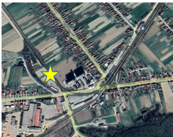
Slika 2. – Lokacija garniture

Mjesto zaustavljanja opožarene dizel motore garniture nalazi se na pruzi oznake R202, regionalna pruga Varaždin - Dalj, sa položajem u KM 072+600 (Slika 2.) otvorena pruga nedaleko od kolodvora Našice (KM 071+582). Navedena pruga projektiran je za osovinsku nosivost od 22,5 tona, te sa definiranom duljinom zaustavnog puta od 700m. Mjesto zaustavljanja opožarene dizel motorne garniture zemljopisni položaj je 45° 29'39" sjever i 18 ° 07'00 istok. Temperatura zraka je iznosila 11 ° C, bila je oblačna noć ,vidljivost je bila dobra i radova nije bilo u blizini.