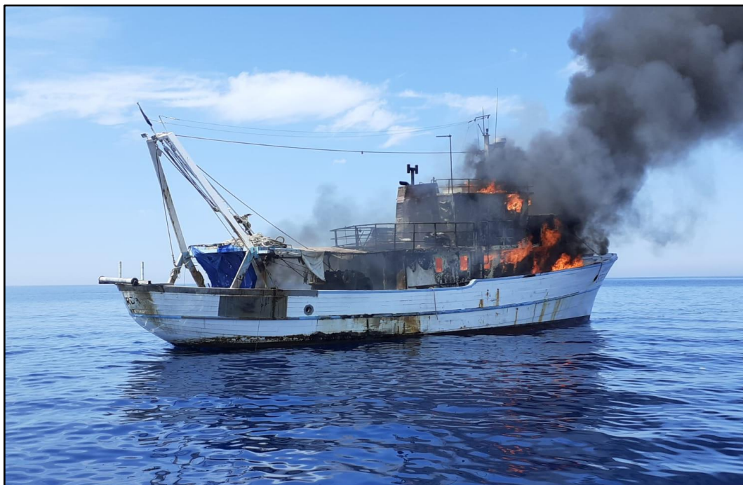
Slika 5. Fotografija broda „Lokarda“ u plamenu po dolasku brodice „Milna“

Prema dnevniku Lučke kapetanije Split – Ispostava Milna, brodica „Milna“ je u 14:10 stigla na mjesto pomorske nesreće. Zatečeno stanje broda je prikazano na slici 5.