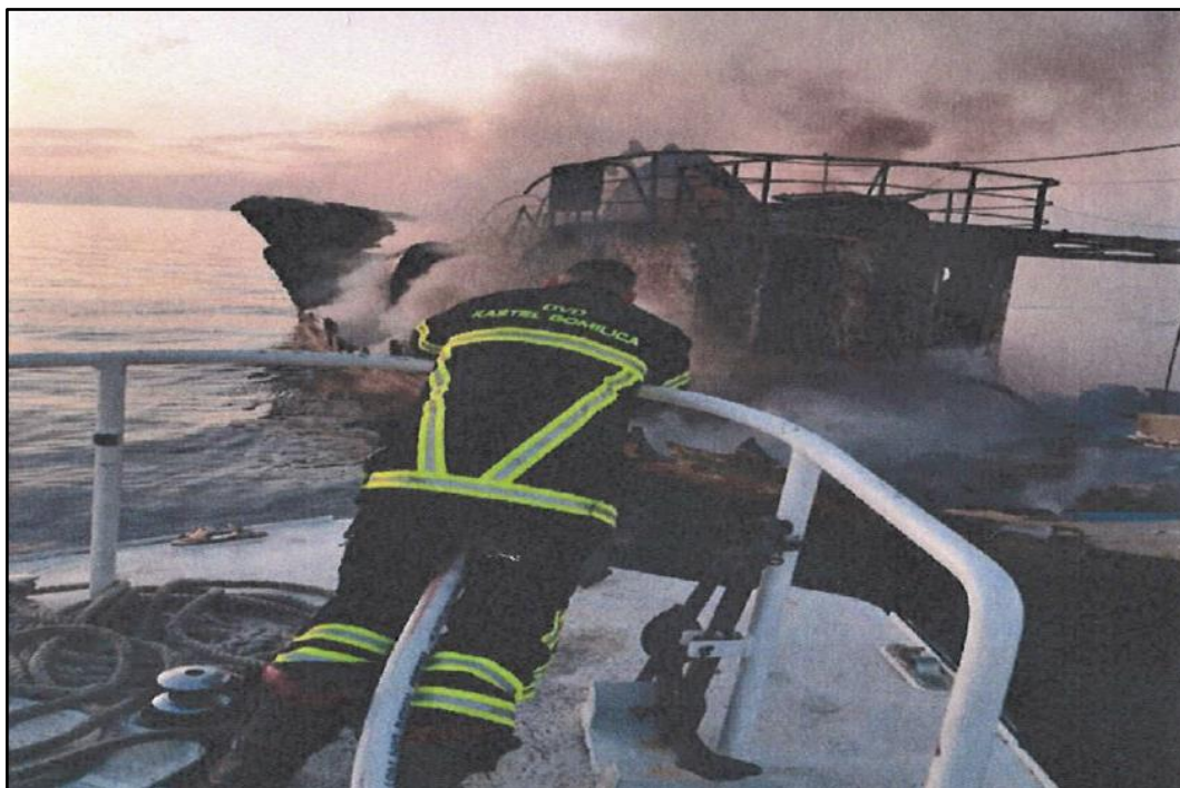
Slika 8. Fotografija gašenja požara na brodu „Lokarda“

U 20:09 je vlasnik ribarskog broda „Lokarda“ obavijestio Lučku kapetaniju Šibenik da je angažirao brod „Voluja“ da otegli brod „Lokarda“. Vlasnik je upozoren da ne smije započeti s tegljenjem dok mu vatrogasci ne potvrde da je sigurno.