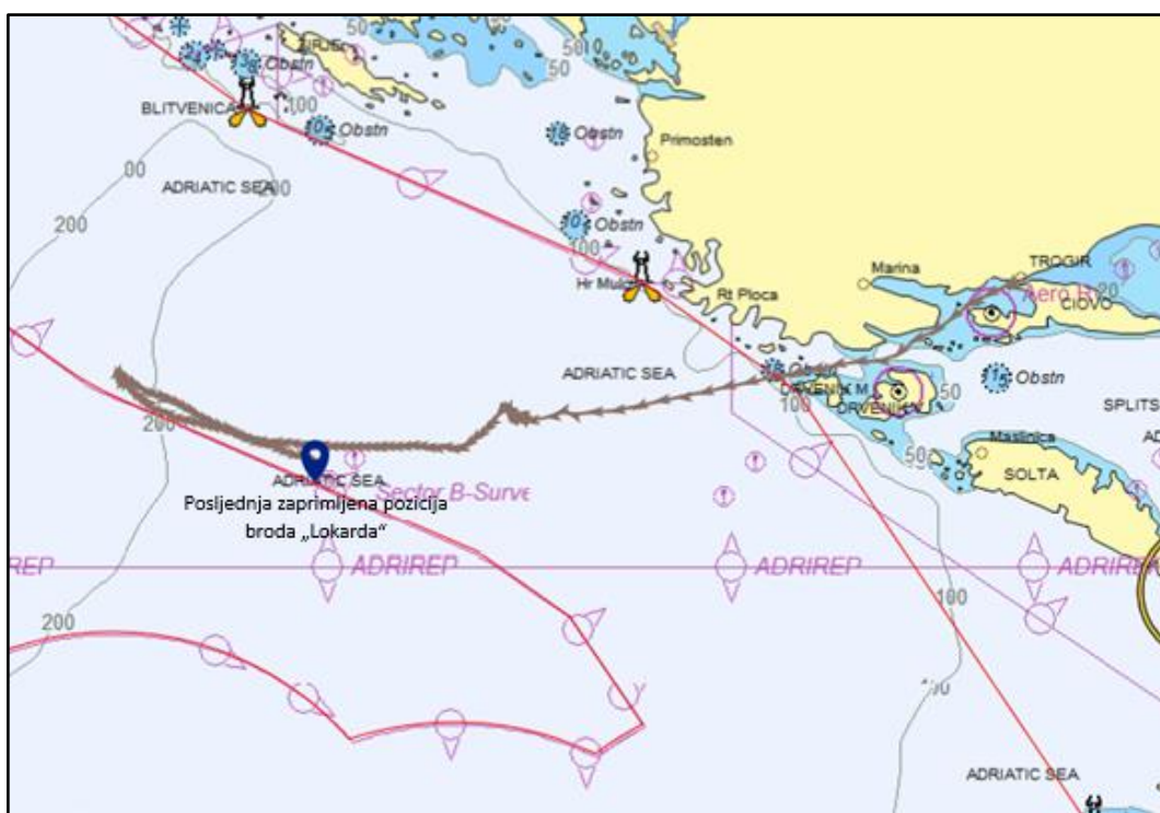
Slika 2. Putovanje ribarskog broda „Lokarda“ iz Trogira s naznačenom posljednjom zaprimljenom pozicijom

Lokacija pomorske nesreće: teritorijalno more Republike Hrvatske (u blizini granice sa ZERP-om) – 15,4 NM južno od uvale Balun na otoku Žirje; posljednja zaprimljena pozicija: \varphi = 43^{\circ} 24' 07'' N, \lambda = 015^{\circ} 38' 02'' E (slika 2).