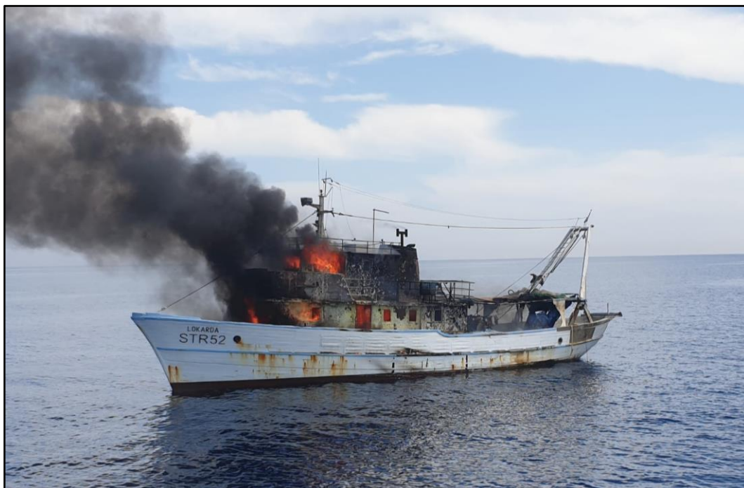
Slika 6. Fotografija broda „Lokarda“ u plamenu po dolasku broda „Šibenik“

Prema izjavi zapovjednika broda „Šibenik“, po dolasku na mjesto pomorske nesreće pokušali su gasiti već razbuktali požar privješenoj protupožarnom pumpom. Kako tijekom korištenja pumpe nije moguće koristiti motor na koji je pumpa privješena za propulziju, isto je otežavalo manevar u blizini opožarenog broda pa su odlučili probati gasiti požar prijenosnom pumpom, ali se ispostavilo da je ona bila preslaba za takav požar. Pokušali su se više približiti brodu, ali nisu mogli zbog topline koja je isijavala s broda. Također, upozoreni su da na brodu ima 5 – 6 plinskih boca. Zbog svega navedenog, u konačnici su odustali od gašenja.