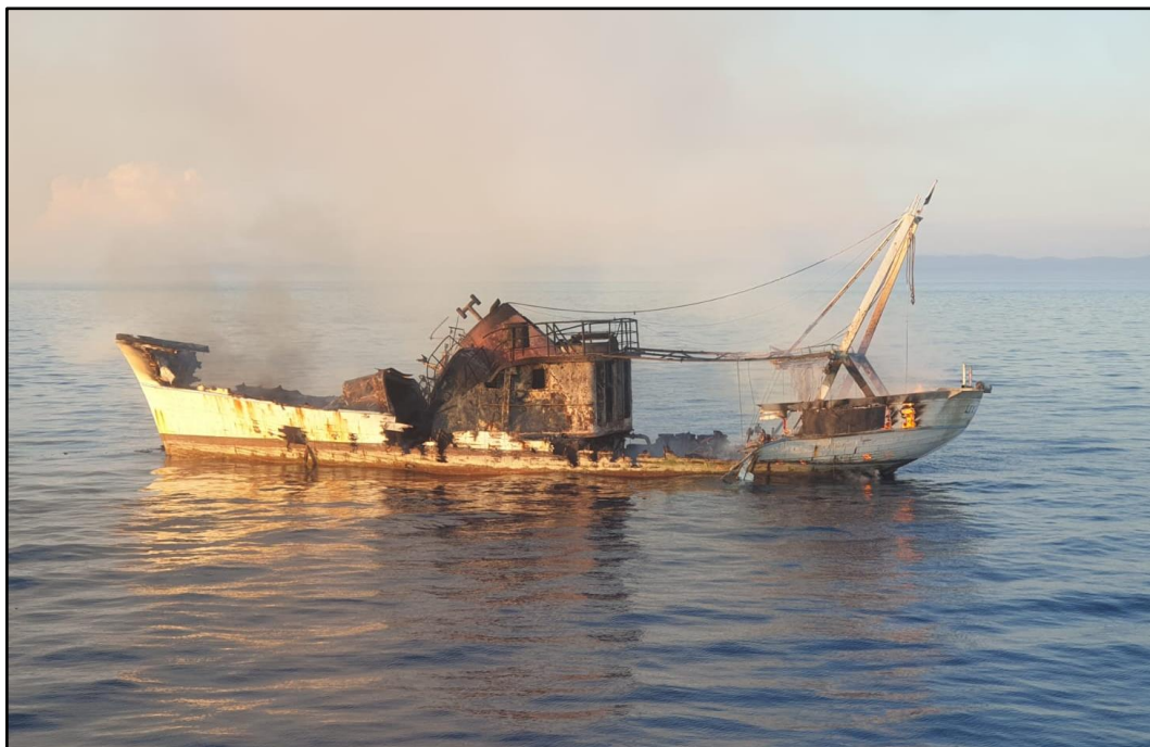
Slika 7. Fotografija broda „Lokarda“ približno u vrijeme organiziranja tegljenja

Prema uputi MMPI-a, bilo je potrebno kontaktirati vlasnika broda „Lokarda“ u svezi s tegljenjem broda jer u slučaju da se vlasnik odrekne broda, tegljenje prelazi u državnu nadležnost. U 19:30 je Lučka kapetanija Šibenik obavijestila vlasnika o organiziranju tegljenja broda „Lokarda“, ukoliko isti u međuvremenu ne potone (približno stanje broda na slici 7). Vlasnik je angažirao brod „Voluja“, koji se uputio prema poziciji pomorske nesreće.