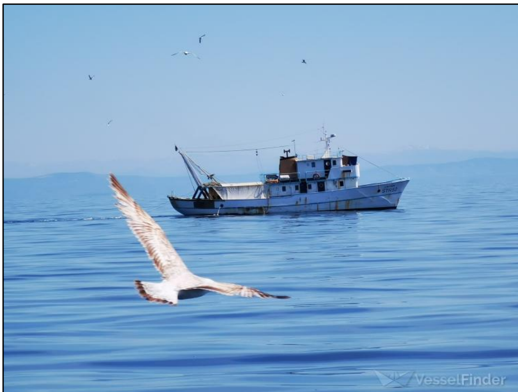
Slika 1. Ribarski brod „Lokarda“