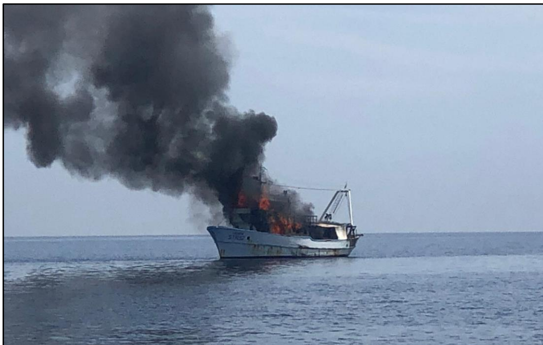
Slika 4. Fotografija broda „Lokarda“ po dolasku broda „Strelica“

Ribarski brod „Strelica“ je oko 13:55 prvi stigao na poziciju pomorske nesreće. Članovi posade broda „Lokarda“ su nađeni kako plutaju na 3 koluta za spašavanje, jednom velikom bokobranu i dvije kašete. Ukrncani su na brod te im je pružena suha roba, ručnici i prekrivači.