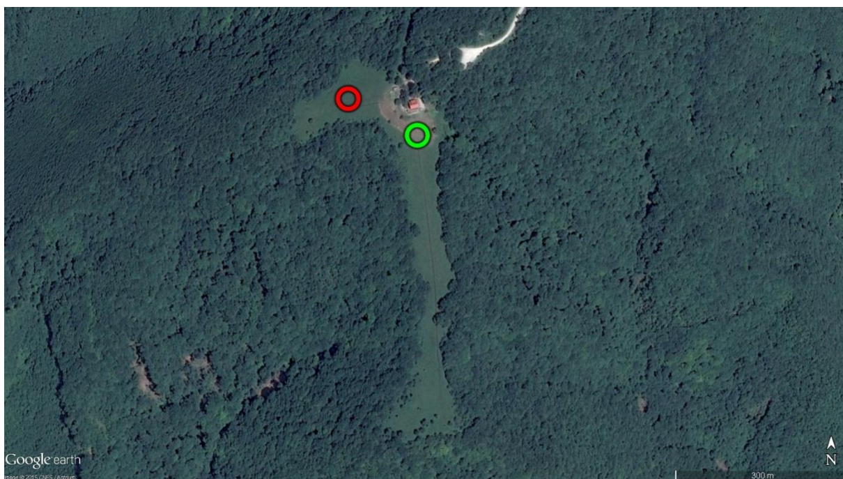
Slika 2. – Uže područje s oznakom mjesta polijetanja (zeleni kružić) i mjesta slijetanja (crveni kružić)