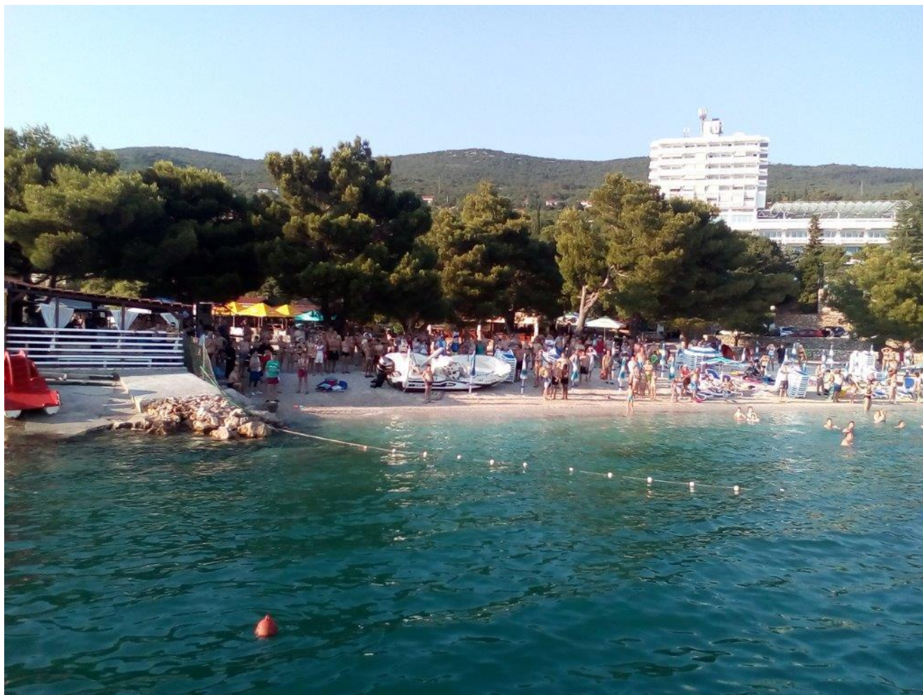
Slika 6. Plaža ispred hotela Omorika i na plaži nasukana brodica oznake "ZD 9572"

Vanjski i unutarnji okoliš: danje svjetlo i povoljni vremenski uvjeti - jugo-istočni povjetarac (jačina vjetra 1 - 2 Bf) brzine vjetra od 4 - 6 čv, naborano do malo valovito more (stanje mora 1 - 2) visine valova u prosjeku od 0,1 - 0,5 m, vedro vrijeme, bez oborina, temperatura zraka oko 29° C, dobra vidljivost oko 10 km, tlaka zraka 1015 hPa. Dubina mora je oko 45 m. Prevladavaju slabe struje morskih mijena do 0,3 čv.