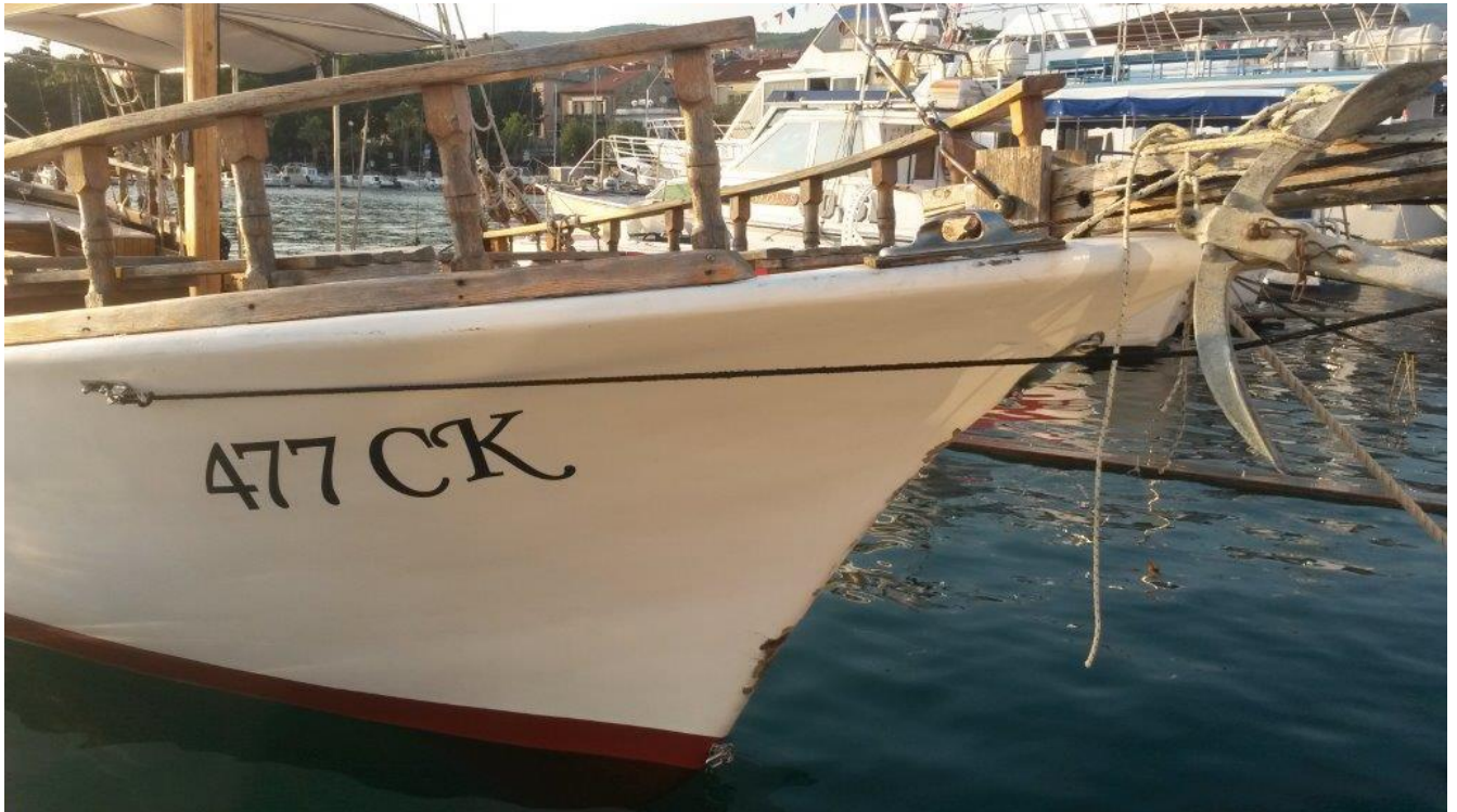
Slika 9. Vidljiva oštećenja pramčanog nadvodnog dijela brodice oznake "477 CK" - gledano s desna