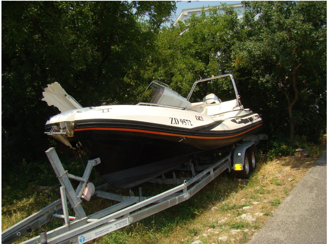
Slika 10. Vidljiva oštećenja na pramcu i sredini nadvodnog dijela brodice oznake "ZD 9572" - gledano s lijeva