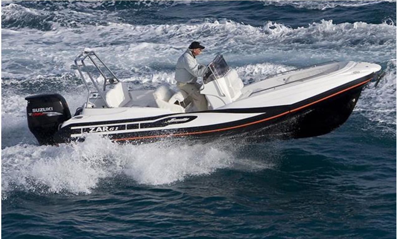
Slika 2. Brodica ZAR 61 - po modelu i izgledu odgovara brodici oznake "ZD 9572"