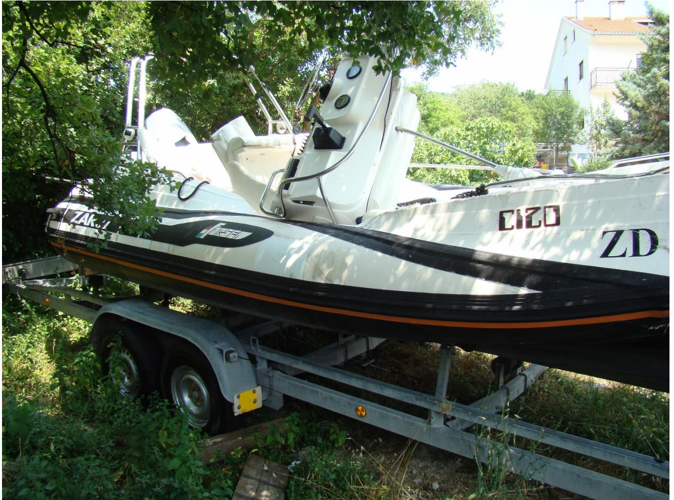
Slika 12. Vidljiva oštećenja na sredini i prema krmi nadvodnog dijela brodice oznake "ZD 9572" - gledano s desna