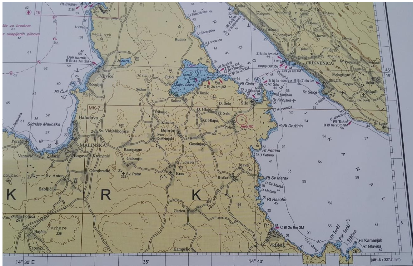
Slika 3. Vinodolski kanal

2) Vinodolski kanal; plaža ispred hotela Omorika (Crikvenica - Dramalj) - pozicija nasukanja brodica oznake "ZD 9572".