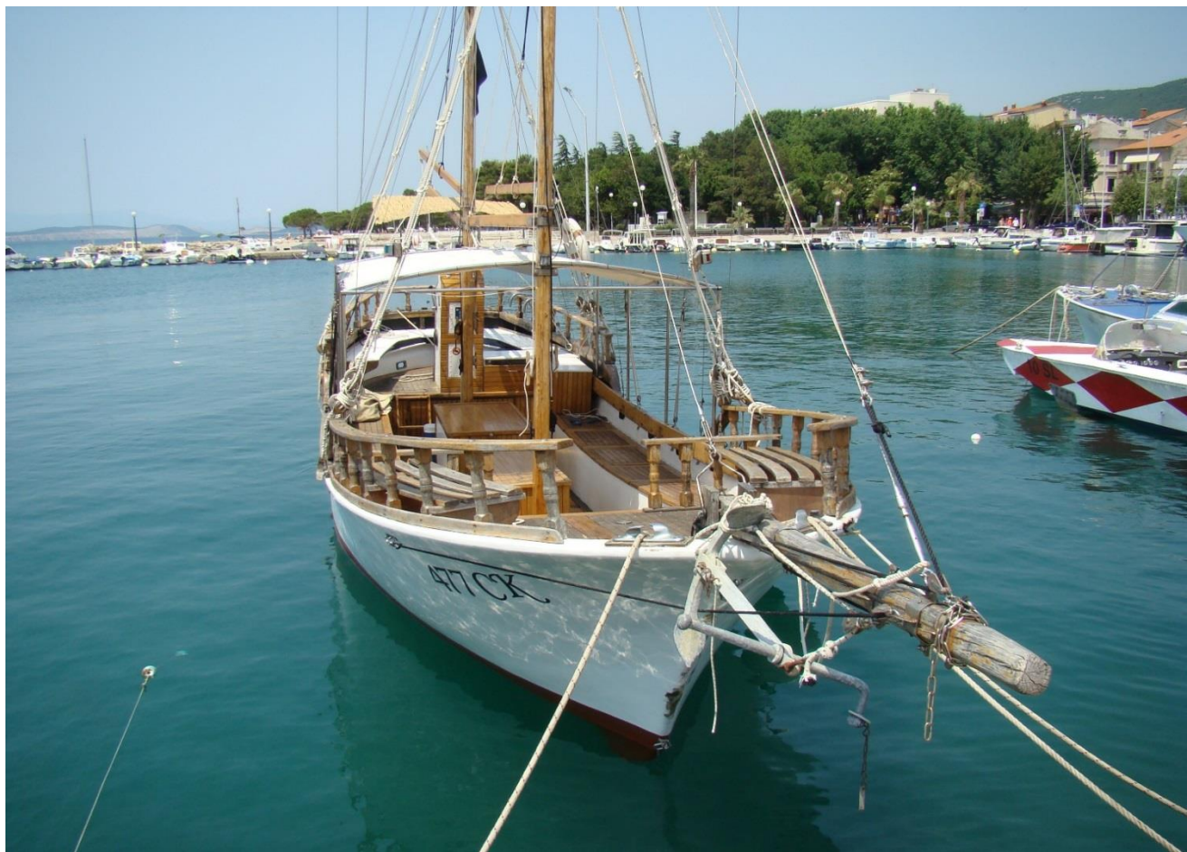
Slika 1. Brodica za prijevoz putnika oznake "477 CK"