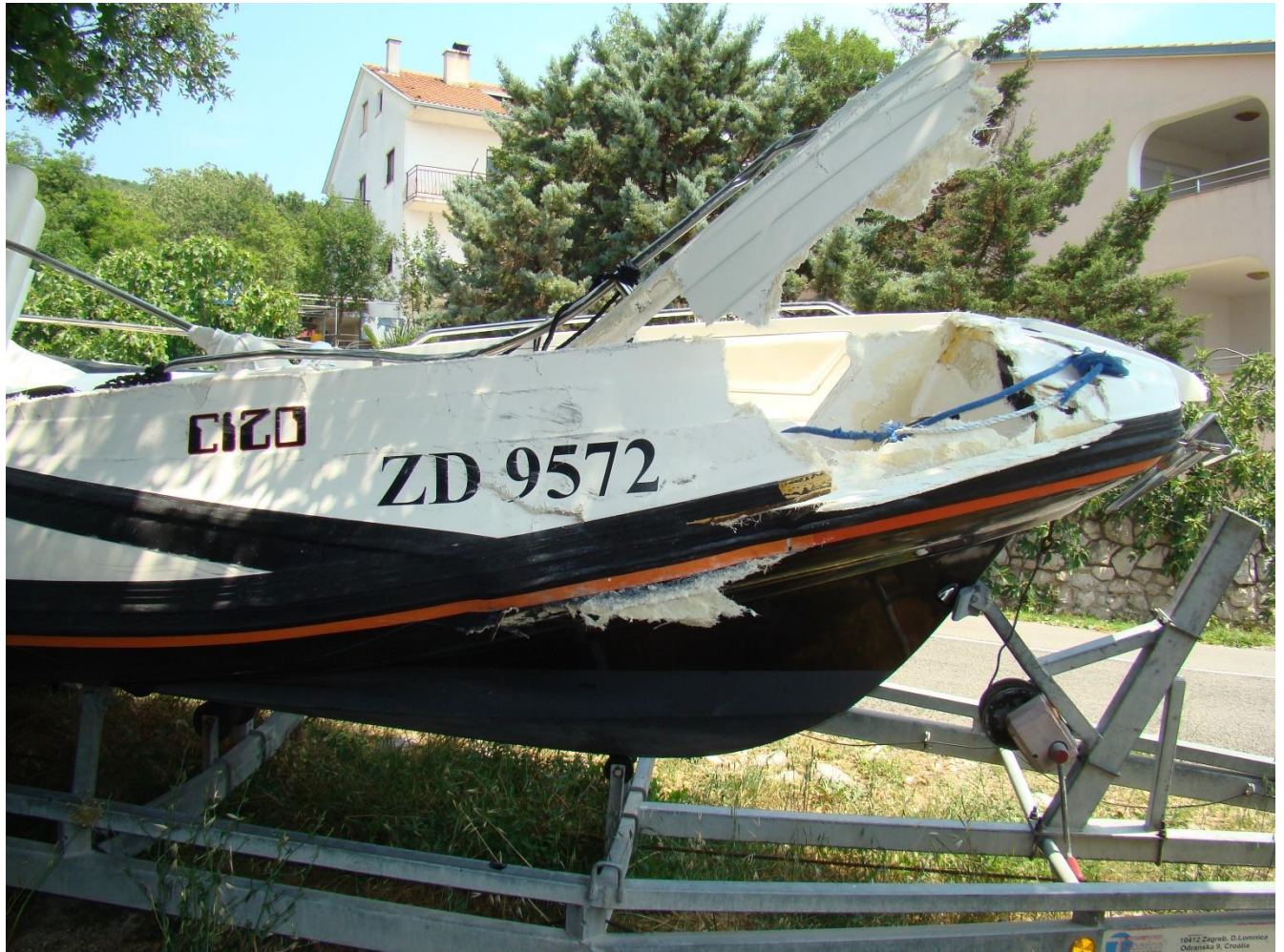
Slika 11. Vidljiva oštećenja na pramcu nadvodnog dijela brodice oznake "ZD 9572" - gledano s desna