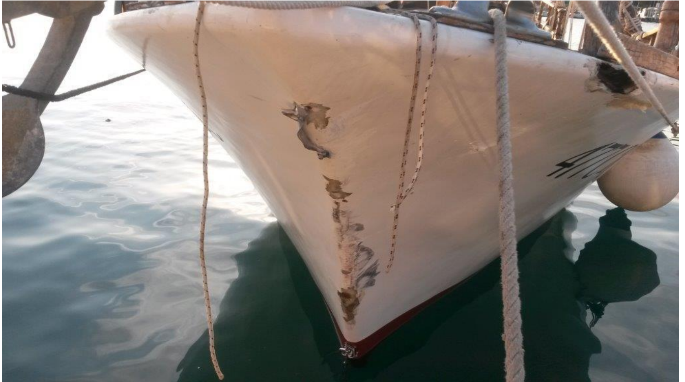
Slika 8. Vidljiva oštećenja pramčanog nadvodnog dijela brodice oznake "477 CK" - gledano iz sredine