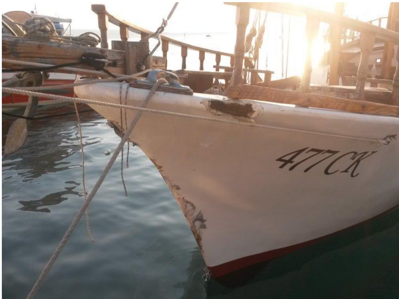
Slika 7. Vidljiva oštećenja pramčanog nadvodnog dijela brodice oznake "477 CK" - gledano s lijeva