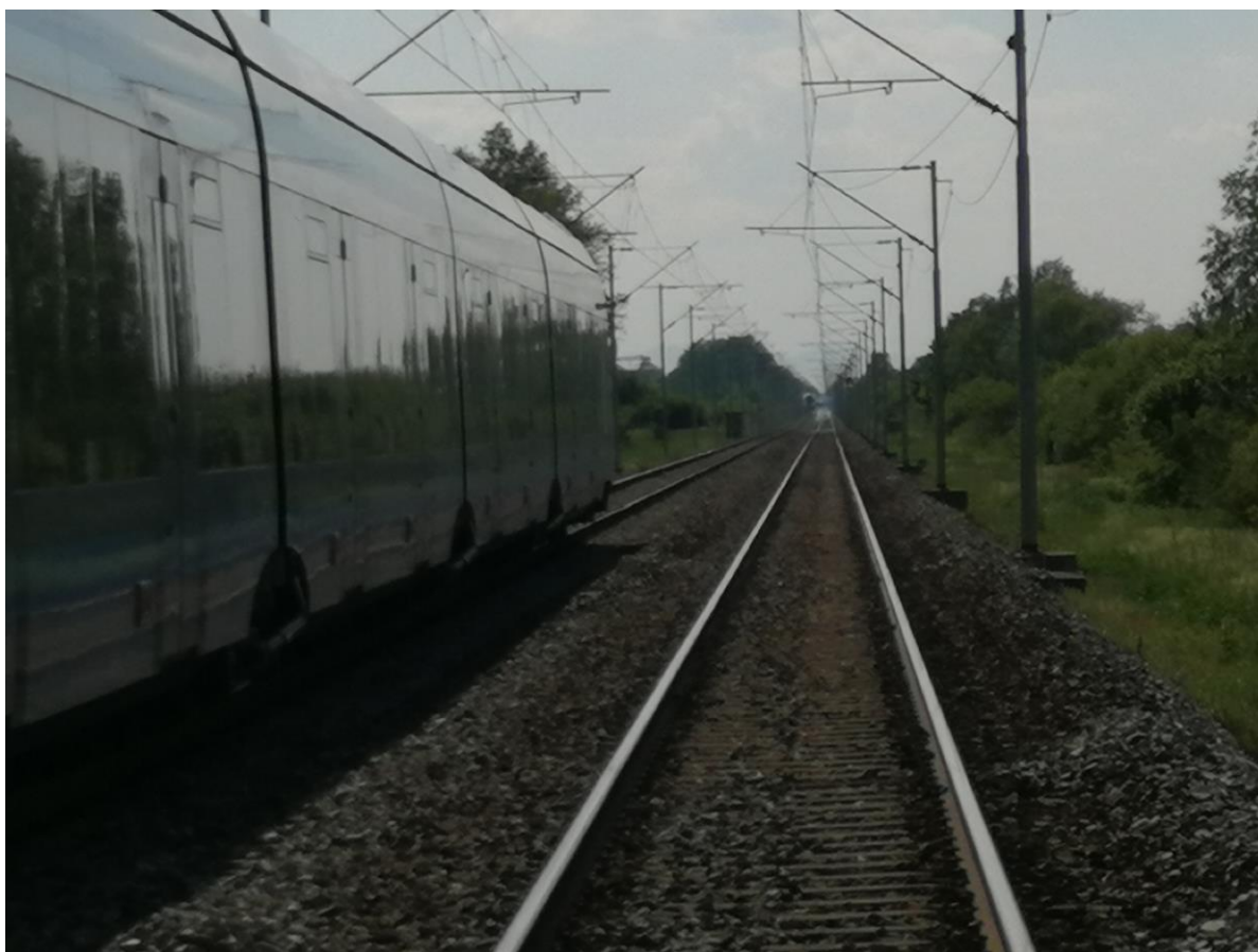
Slika 1. – Slika incidenta sa zaustavljenim vlakovima

Dana 05. svibnja 2023. godine u 12:30 sati na pruzi oznake M104, između kolodvora Andrijevc i Garčin, izbjegnuto je sudar putničkih vlakova broj 2018 i 2011. Vlak br. 2018 zaustavio se u km 199+270 jer je strojovođa primjetio drugi vlak koji prometuje prema njemu istim kolosijekom i uslijed zaprimljenog telefonskog poziva od prometnika vlakova kolodvora Andrijevc koji ga upozorava da se zaustavi, dok se vlak br. 2011 zaustavio u km 200+750 jer se prostorni signal 301 promijenio u signalni znak „Stoj“ i jer je strojovođa primjetio drugi vlak koji prometuje prema njemu istim kolosijekom (Slika 1.). U trenutku nastanka incidenta u vlakovima se nalazilo ukupno 127 putnika (45 putnika u vlaku broj 2011 i 82 putnika u vlaku broj 2018), nitko nije ozlijeđen niti je nastala materijalna šteta. Za vrijeme incidenta izvodili su se građevinski radovi zbog strojnog reguliranja skretnica i uređenja ŽCP-a u kolodvoru Garčin. Predviđeni zatvor lijevog kolosijeka između kolodvora Andrijevc-Garčin započeo je dana 05. svibnja 2023. godine u 07:00 sati i prestao u 10:27 sati, dok je zatvor desnog kolosijeka između kolodvora Andrijevc-Garčin započeo istog dana u 10:50 sati i prestao u 13:56 sati.