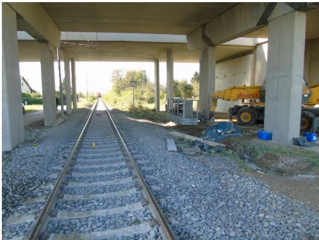
Slika 1. – Slika mjesta nesreće

Dana 27. rujna 2023. godine u 08:05 sati na pruzi oznake M407, između kolodvora Zagreb Žitnjak i Velika Gorica dogodila se nesreća osoba koje uključuju željezničko vozilo u pokretu (Slika 1.). Blizu mjesta nesreće, za vrijeme zatvora pruge izvodili su se građevinski radovi sanacije cestovnog nadvožnjaka. Predviđeni zatvor pruge i radovi sanacije cestovnog nadvožnjaka trebali su započeti odmah nakon prolaska vlaka broj 89135. U trenutku prolaska vlaka broj 89135 ispod cestovnog nadvožnjaka dolazi do naleta na radnika koji je stajao uz lijevu stranu kolosijeka. Ozlijeđeni radnik tog dana nije radio nego je došao na gradilište kako bi dostavio doznake od bolovanja, te je usput htio provjeriti u kojoj fazi je sanacija radova. U navedenoj nesreći teško je ozlijeđen radnik tvrtke koja je obavljala poslove sanacije cestovnog nadvožnjaka koji prolazi preko pruge M407 u km 013+764, materijalna šteta na željezničkom vozilu i željezničkoj infrastrukturi nije zabilježena.