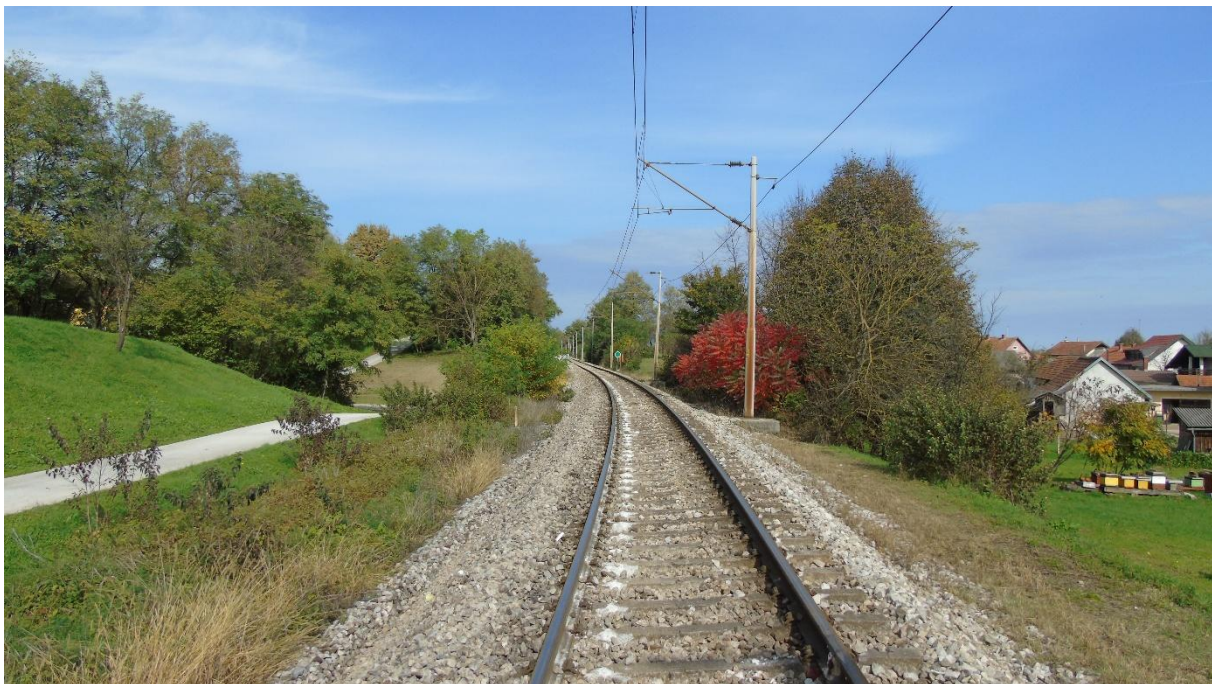
Slika 1. – Bliža slika mjesta ozbiljne nesreće

U ozbiljnoj nesreći nije bilo ozlijeđenih niti smrtno stradalih osoba, dok je nastala velika materijalna šteta na željezničkoj infrastrukturi i na željezničkim vozilima.