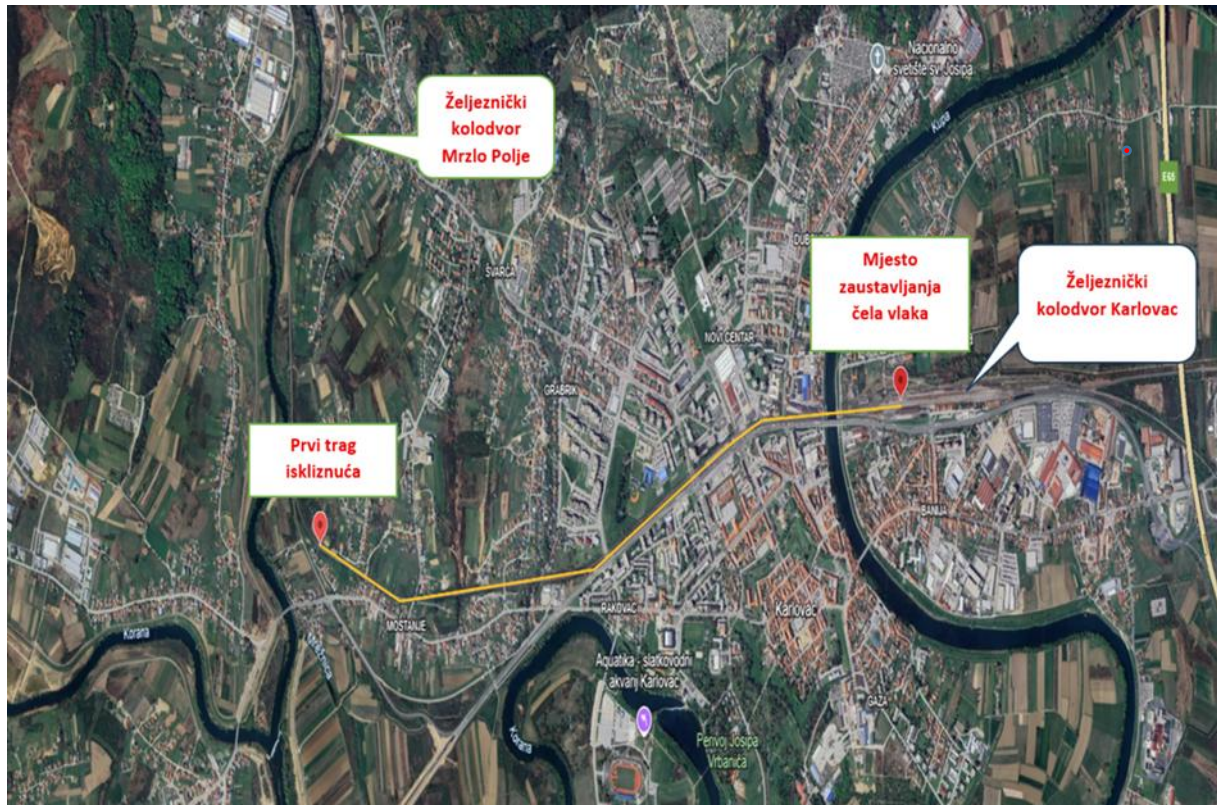
Slika 2. – Prikaz mjesta ozbiljne nesreće

U trenutku ozbiljne nesreće bila je noć, vanjska temperatura iznosila je 12°C, nije bilo padalina.