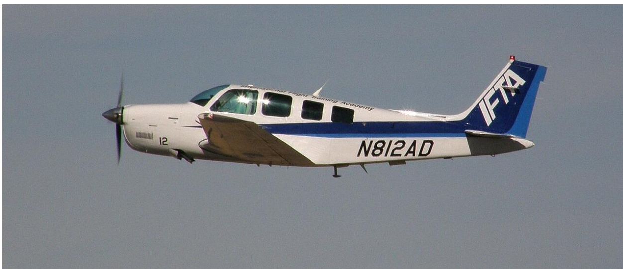
Slika 2. – avion Beechcraft G36 Bonanza

Bonanza je u upotrebi od 1947. godine i to je avion s najdužom kontinuiranom proizvodnjom u povijesti. Od tada je razvijeno više varijanti ovog aviona, a Bonanza G36 u upotrebi je od 1968. godine. Zbog dobrih performansi i luksuzno uređenog interijera, koristi se i kao business avion za regionalne letove.