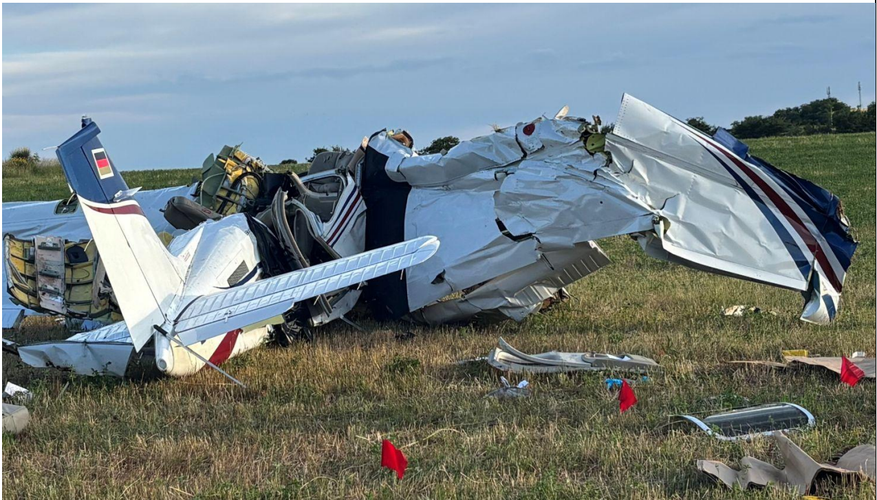
Slika 3. – olupina na mjestu pada

Deformacije na propeleru ukazuju da se u trenutku udara nije okretao. U rezervoarima nije pronađeno gorivo, kao niti u ostalim elementima gorivog sustava. Nije bilo izlijevanja goriva u tlo. Nije došlo do gorenja, odnosno požara.